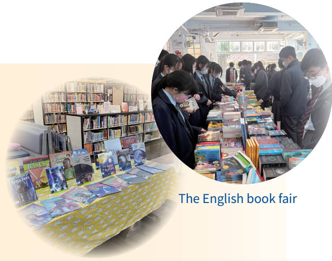
The English book fair