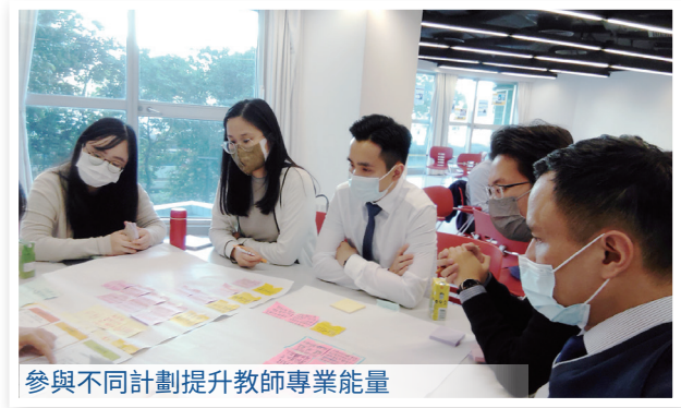
參與不同計劃提升教師專業能量

近年，本校先後參加香港中文大學優質學校改進計劃、教育燃新教育要創變跨界共學計劃、教育局資優教育學校網絡計劃、教育研究計劃、校本專業支援計劃等，分別就課程規劃、資優教育、價值觀教育與教育局官員、友校老師及專家進行專業交流。團隊同時囊括多項教學大獎，多次受邀分享校本經驗，獲各界一致好評。