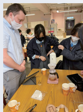
Coffee Making Workshop