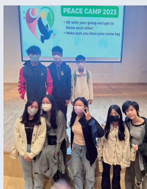
International Peace Camp