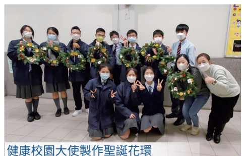
健康校園大使製作聖誕花環