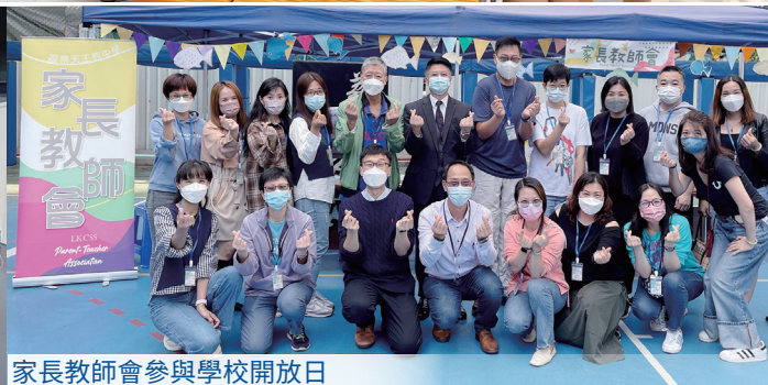
家長教師會參與學校開放日