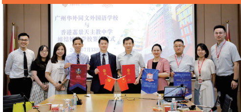
本校與廣州華外同文 外國語學校締結為姊妹學校

校友會透過各活動及計劃，聯繫歷屆校友，推動母校的發展。每年校友會均會聯同生涯規劃委員會，舉辦職業分享講座，為高中學生提供就業資訊。校友會又設立獎學金，獎勵在學業、品德及體育有傑出表現的學生。這展現了校友對學生成長的關心和支持，為學生和學校創造更多的機會和福利。