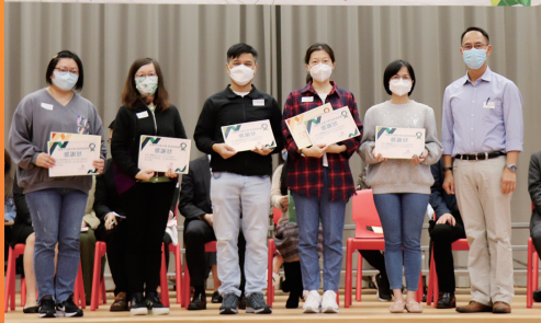
家長教師會周年大會暨執行委員會選舉