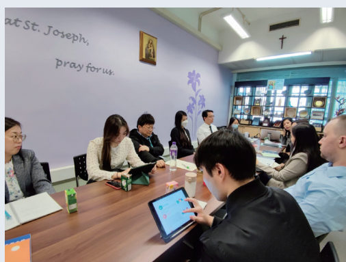
Professional development for English teachers

The mission of the English Department is to empower our students to become proficient and confident English learners who can communicate naturally and effectively. We believe that English is not just for academic purposes, but also for daily interactions. To facilitate this, we strive to create an immersive English environment where students can practise and improve their language skills. Our department offers a diverse range of English activities and competitions to engage students and foster their passion for English.