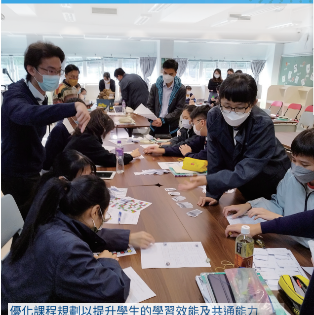
優化課程規劃以提升學生的學習效能及共通能力