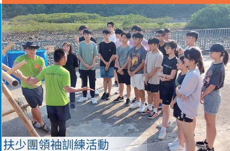
扶少團領袖訓練活動

自二零零七年起，香港都會扶輪社已與本校結為夥伴，歷任社長及社友均與本校師生合作無間，贊助多項學校活動，例如：探訪長者日及領袖訓練營。香港都會扶輪社又和生涯規劃委員會合辦「良師益友計劃」，透過師徒配對，學生可與扶輪社的社會賢達交流，對學生未來升學或就業均有莫大幫助。