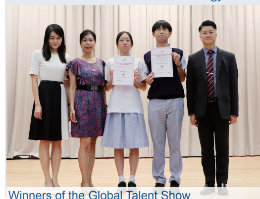
Winners of the Global Talent Show

We take great pride in showcasing the exceptional works of our students by publishing the Starfish magazine annually and the Anthology every two years. These publications serve as a source of inspiration, encouraging our students to strive for even greater accomplishments in their academic and creative endeavors.