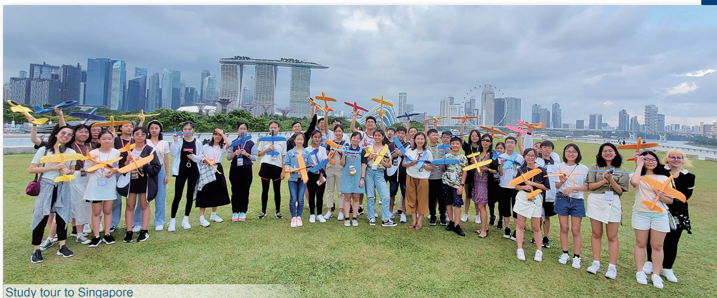
Study tour to Singapore