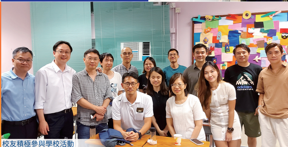
校友積極參與學校活動

本校與廣州的華外同文外國語學校結盟，成為姊妹學校。透過姊妹學校之間的合作關係，可以促進友誼，加深跨地域文化的了解和尊重，擴大學校網絡，共同提升教育素質。