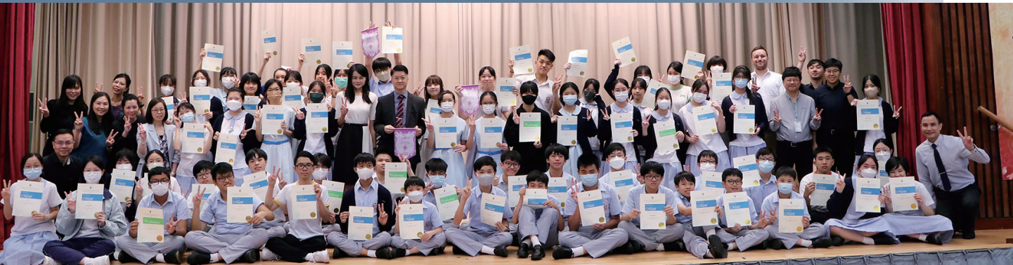
Winners of Hong Kong Schools Speech Festival

Our students consistently demonstrate active participation and achieve exceptional results in the prestigious Speech Festival. In the academic year 2022-2023, out of 90 participating students, over 90% of our participants received either a place or a merit.