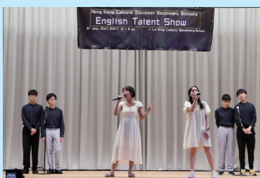
Our students in the English Talent Show