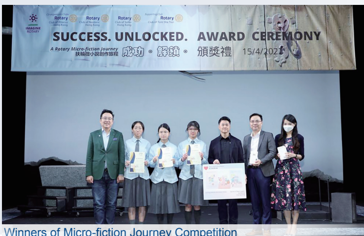
Winners of Micro-fiction Journey Competition