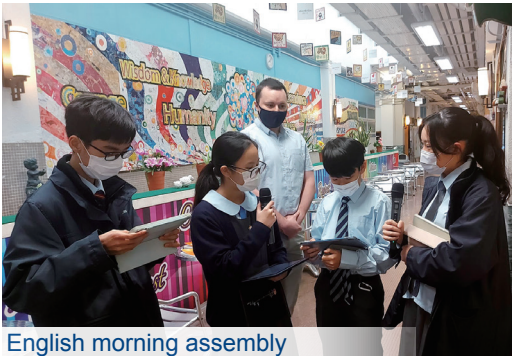
English morning assembly