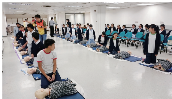
醫校同行之心肺復甦法訓練

本校推行生命馬拉松獎勵計劃，旨在培育學生的責任感及自我管理 ability，指引學生在靈德智體群美六育各範疇上自訂目標，及努力達致設定的標準，同時亦邀請家長作評核者，學校按學生的表現在學期結束前頒發鑽石、金、銀、銅獎項，以資鼓勵。