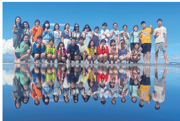
學生參加境外交流團攝於馬來西亞瓜拉雪蘭莪(天空之鏡)