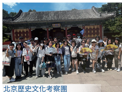
北京歷史文化考察團