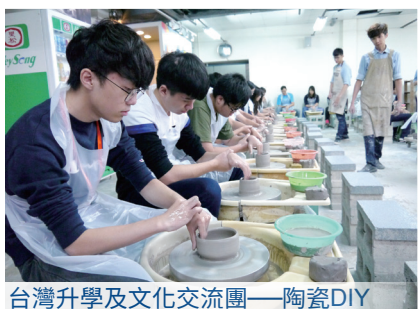
台灣升學及文化交流團——陶瓷DIY