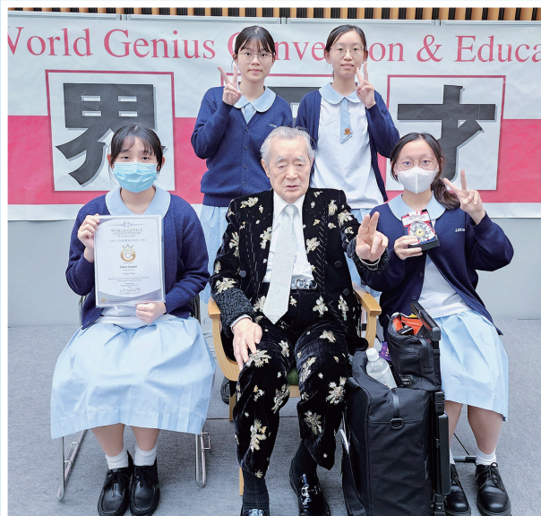
日本知名發明家中松義郎博士高度評價本校學生的STEAM發明品隨機認便