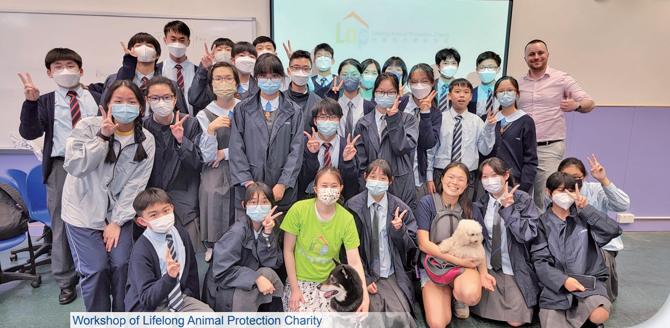
Workshop of Lifelong Animal Protection Charity