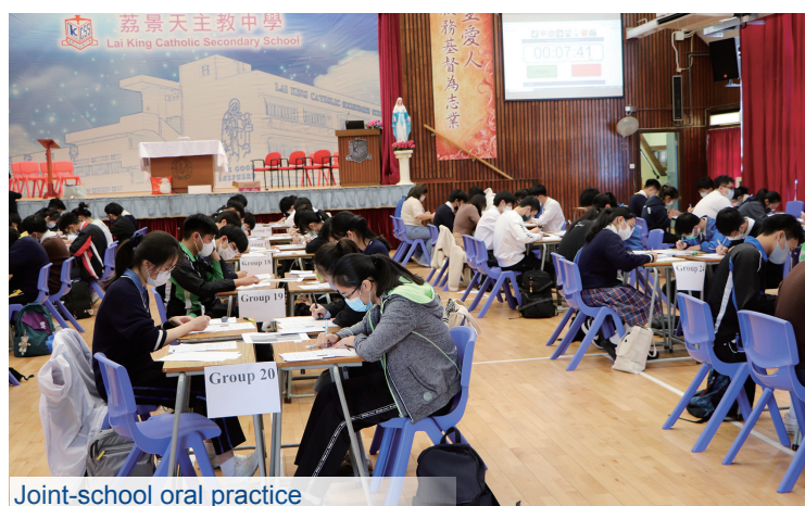
Joint-school oral practice

We have implemented small class teaching in both junior and senior forms, as it enables our teachers to provide individualized support to each student. To further cater to students of varying abilities, we offer specialized enhancement classes and summer classes. Additionally, our joint school speaking practice serves as a supportive platform for students to interact with their peers from different schools.