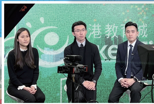
香港教育城專訪本校得獎教師團隊