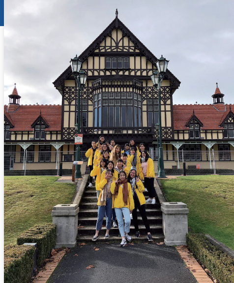
Study tour to New Zealand and Australia

Embarking on international tours not only fills our students with joy and laughter but also empowers them to explore, connect, and thrive in the global community. Immersing themselves in an English-speaking environment during these trips inspires and motivates our students to communicate in English with increased confidence and fluency.