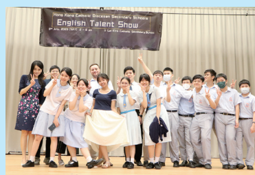
Helpers and performers of English Talent Show

Our students are consistently provided with exceptional opportunities to learn, grow, and showcase their distinct talents on stage. One such platform is the highly anticipated annual English Talent Show, where our students eagerly demonstrate their extraordinary abilities in various performing arts.