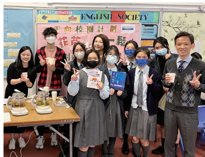
家長日正向教育活動花茶鬆一鬆