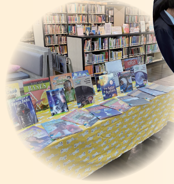
The school library