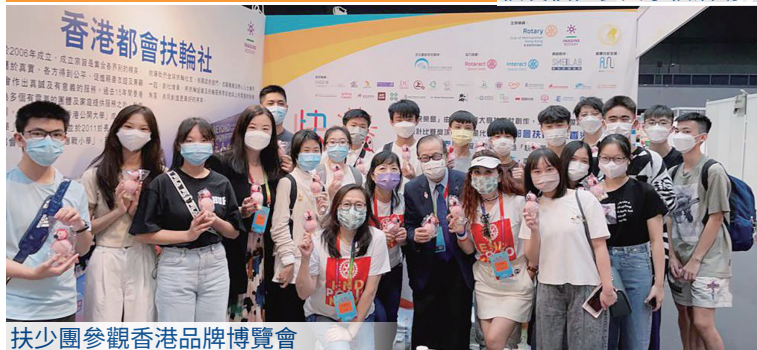
扶少團參觀香港品牌博覽會