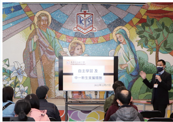
透過家校合作培育學生建立良好的學習習慣