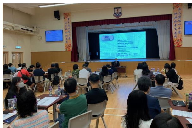
聯校培訓研習國安教育