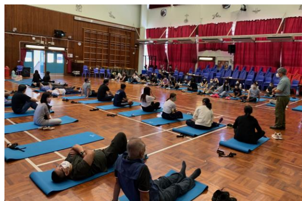
放鬆心情、紓緩壓力的運動