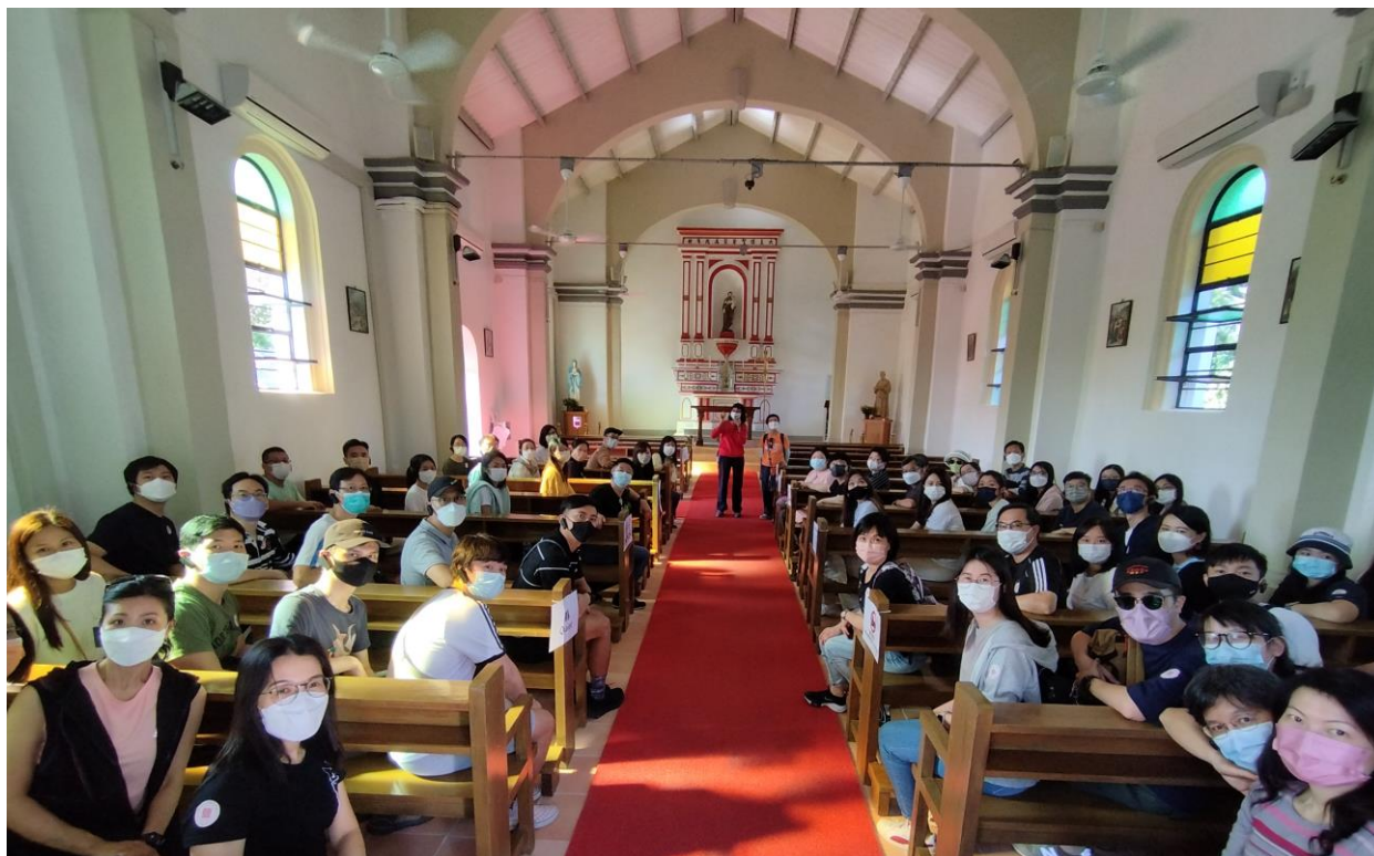
鹽田梓保育及朝聖之旅