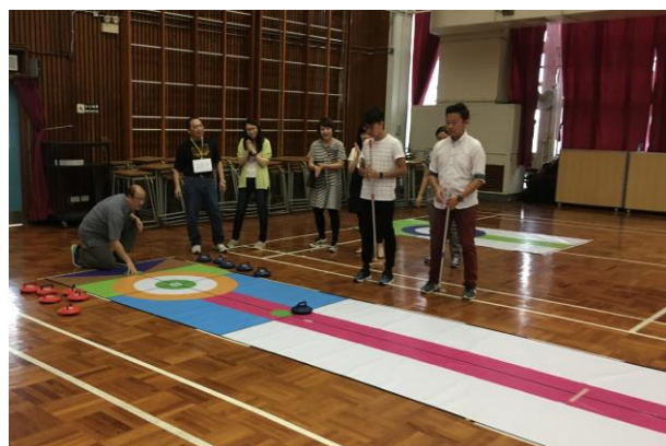
學習「推地壺」，同事樂在其中