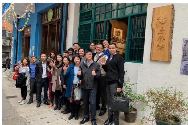
遊灣仔藍屋建築群，感受獨特社區文化