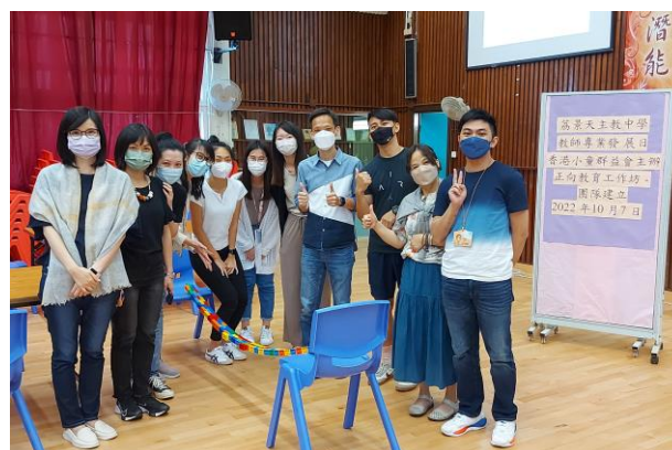
透過輕鬆活動提升團隊精神