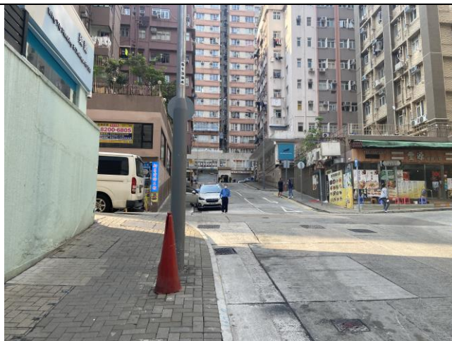
沿北景街前行 往 建華街