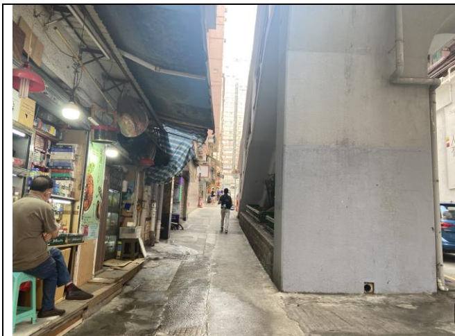
沿行人天橋左方 右轉上 北景街(斜路)