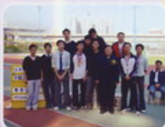
校長與獲獎者合照