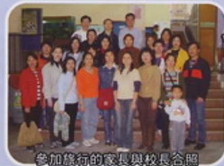
參加旅行的家長與校長合照

我是第一次有機會參加，由家長陪同學生參與的全校旅行。在旅行過程中，使我感受到同學們互相幫助、師生間那種融洽和家長與學生中的互相尊重，多麼和諧及親切，但這種情景並不是每一位家長可以親身感得到的。