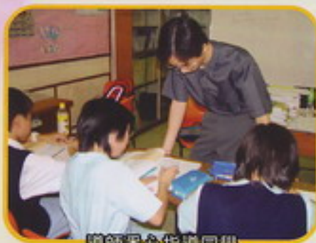
導師悉心指導同學

到校功課輔導班已開辦了三個月。我們的功課輔導服務得以順利開展，實有賴家教會、家長、學校及老師各方的協助及支持。