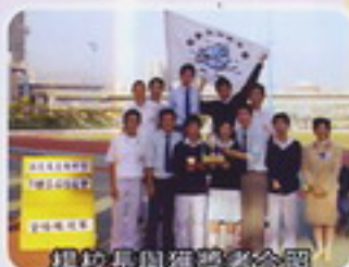
楊校長與獲獎者合照