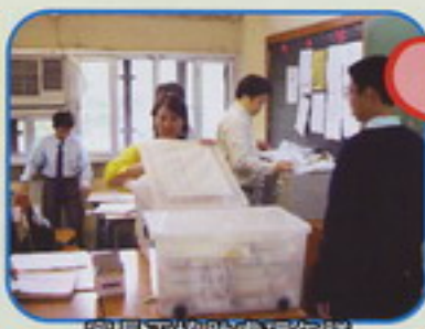
家長正協助處理午膳