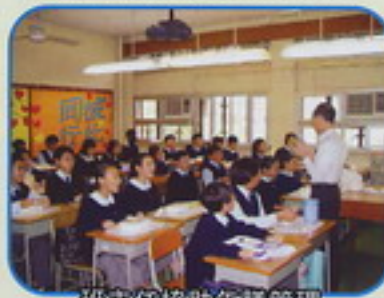
班主任協助午膳管理