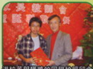
洪校董與獲獎的同學拍照留念