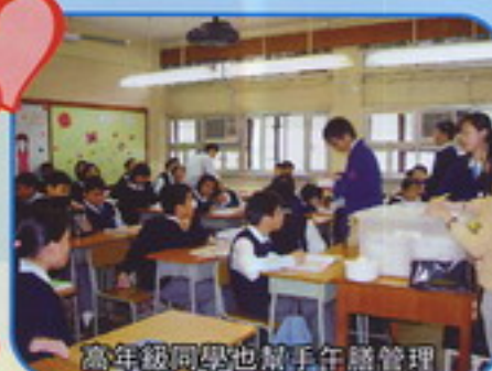
高年級同學也幫手午膳管理