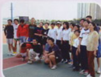
二人三足比賽即將開始！ 大家拍照留念