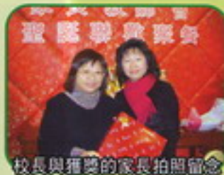
校長與獲獎的家長拍照留念