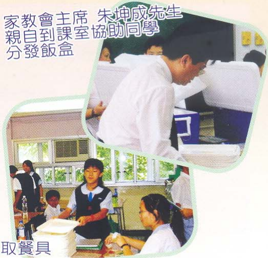
同學有秩序地領取餐具