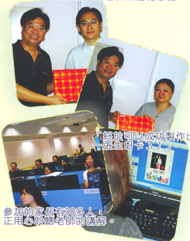
參加的家長有30多人，正用心聆聽老師的講解。