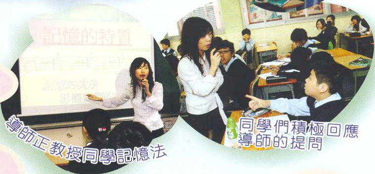
導師正教授同學記憶法