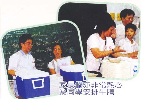
家長們亦非常熱心 為同學安排午膳

校長和老師給我的感覺既友善又親切，每人都很愛護學生；而學生每每給我的感覺都是很有禮貌，所以在開學不久之後，我便沒有再擔心女兒能否適應中學生活的問題了。