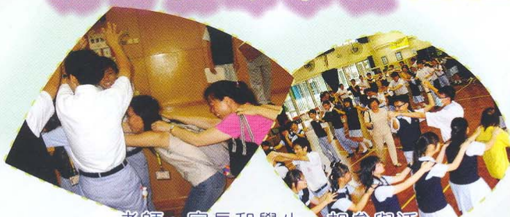
老師、家長和學生一起參與活動，與晨暉學校學生打成一片。