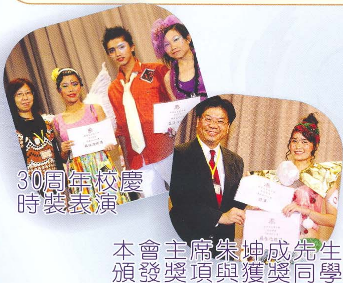
30周年校慶 時裝表演

4) 本會在每年的畢業禮和散學禮中，均會贊助「最佳成績獎」及「最佳進步獎」兩項獎項以鼓勵同學努力向上的精神。