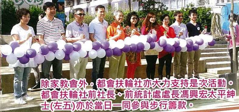
除家教會外，都會扶輪社亦大力支持是次活動。都會扶輪社前社長、前統計處處長馮興宏太平紳士(左五)亦於當日一同參與步行籌款。

2012年11月4日，學校為慶祝三十五周年，於迪士尼樂園旁的迪欣湖舉行了大型的步行籌款活動。當日總參加人數接近2000人，其中也超過200名家長與子女一同參與活動。活動共籌得逾35萬的款項，用作改善學校設施。