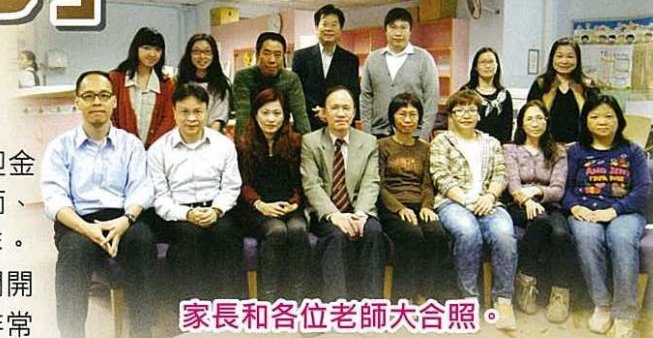
家長和各位老師大合照。

學校舉辦不同形式的活動，讓家長有機會參與其中，能讓家長更了解同學在學校的生活，所以參加家教會最能令家長安心。