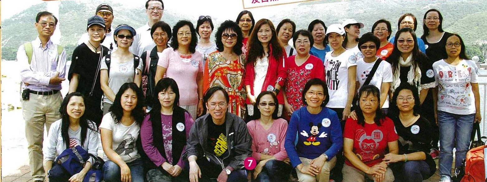
家教會幹事們與校長在終點合照。