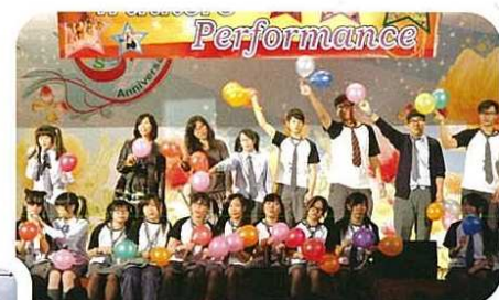
5D 班精彩的表現，感動了全場師生。