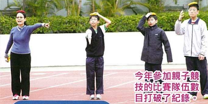
今年參加親子競技的比賽隊伍數目打破了紀錄。