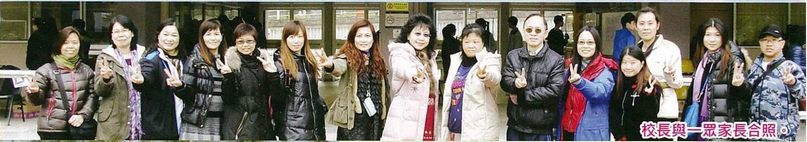
校長與一眾家長合照。