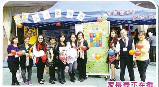
家長義工在攤位前合照。

於本年學校開日，我們迎接了很多參觀本校的應屆升中一學生及家長，他們對本校的支持和信任，令我們感到相當高興和欣慰。回想當時與兒子第一次參觀開放日，有如昨天的事情，看見兒子在本校愉快成長，實不得不感激校長及各位老師對同學們悉心教導及培育。祝願各位身體健康，生活愉快。