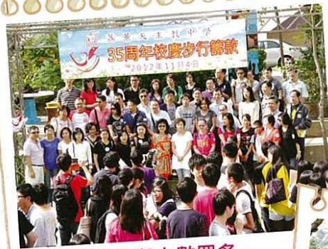
是次活動參與人數眾多，反應熱烈。

我和幾位家長邊行邊說，轉瞬間已到達終點並立時留下倩影，各人滿懷著喜樂及依依不捨的心情完成是次活動。今次的活動真能表現學校上下一心的團結精神，為此感謝學校，為同學們謀求福祉，增添完善的校園設施，使同學們能享用更美好的校園生活，並祝學校邁向更多的35周年。