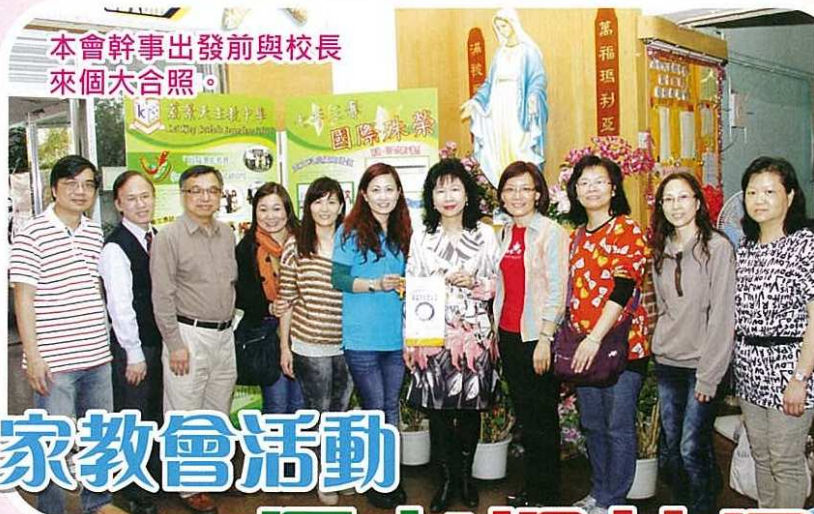
本會幹事出發前與校長 來個大合照。