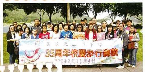
家教會總動員、大力支持步行籌款！