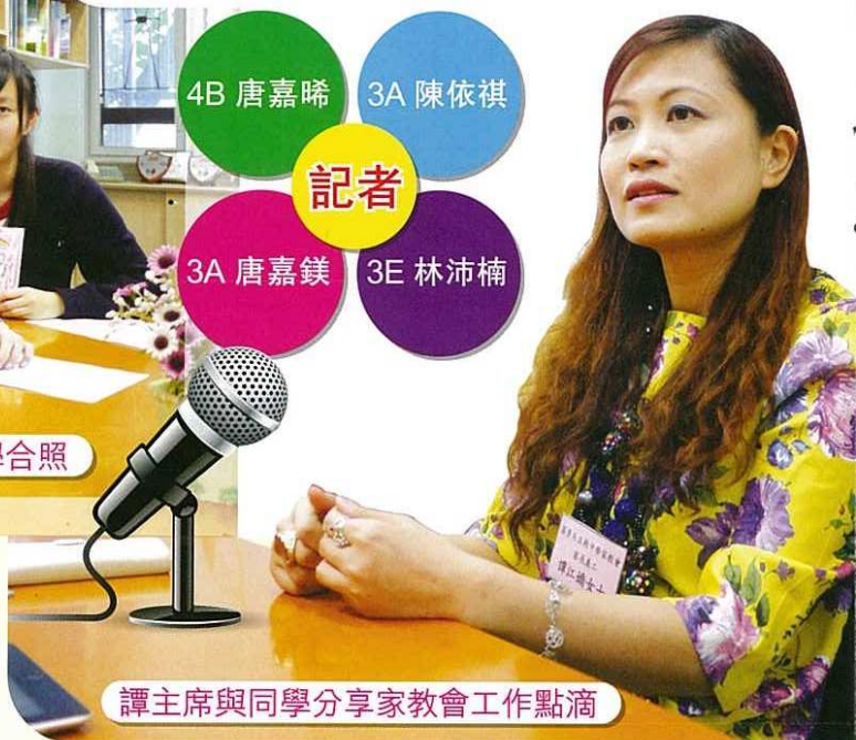
譚主席與同學分享家教會工作點滴