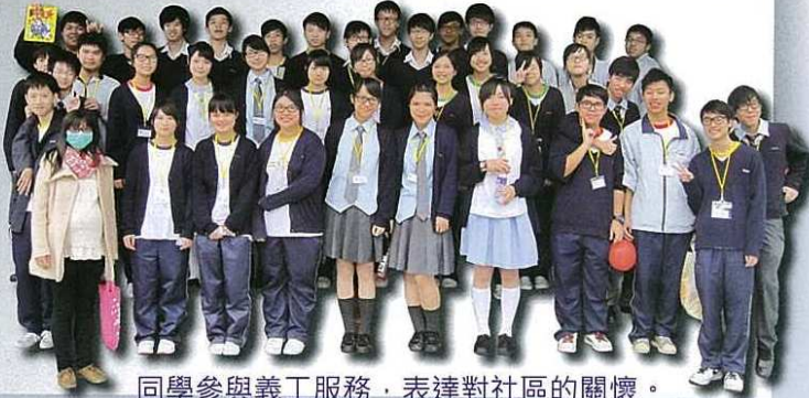
同學參與義工服務，表達對社區的關懷。

在 2012 年 11 月 16 日，本人有幸被邀請擔任時裝設計比賽的頒獎和評判工作。首次參與這類活動，感覺很新鮮。是次活動以「活着的九十後」及環保為主題，參賽者在台上雖然只有短短數分鐘的表演，但已看出他們為此次比賽設計而付出的努力。各參賽者表演皆很出色，作為評判的我亦難定勝負。