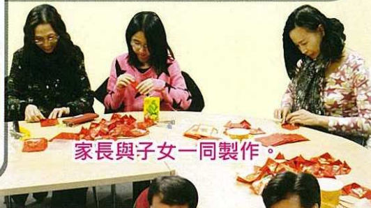
家長與子女一同製作。