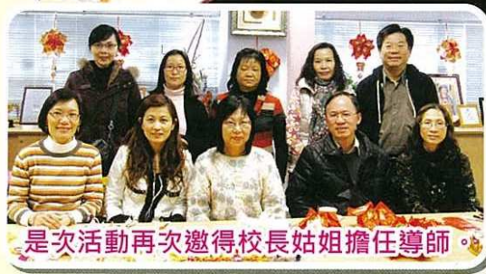
是次活動再次邀得校長姑姐擔任導師。