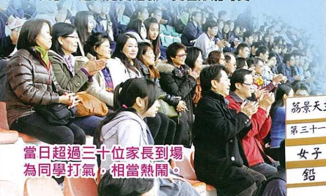
當日超過三十位家長到場為同學打氣，相當熱鬧。