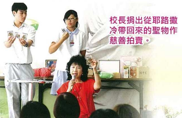
校長捐出從耶路撒冷帶回來的聖物作慈善拍賣。