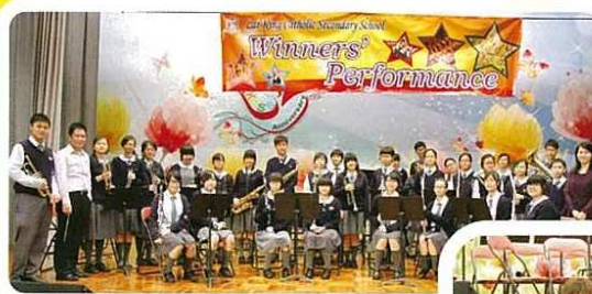
管樂團的成績不斷進步。