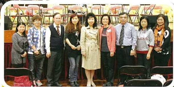
本會幹事獲邀欣賞優勝者表演，分享同學的努力成果。