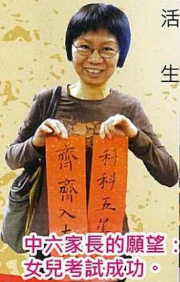
中六家長的願望： 女兒考試成功。