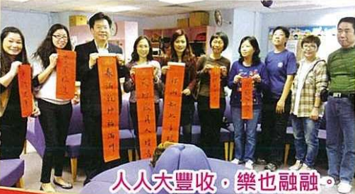
人人大豐收，樂也融融。