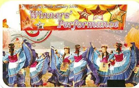
舞蹈組的表現一如以往出色。

5D 班的團結，發揮了 39 位同學的團隊精神，有賴老師們悉心教導、帶領。令台下的我們也十分投入和興奮。