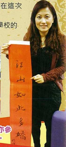
主席譚江女士亦參與了是次活動。