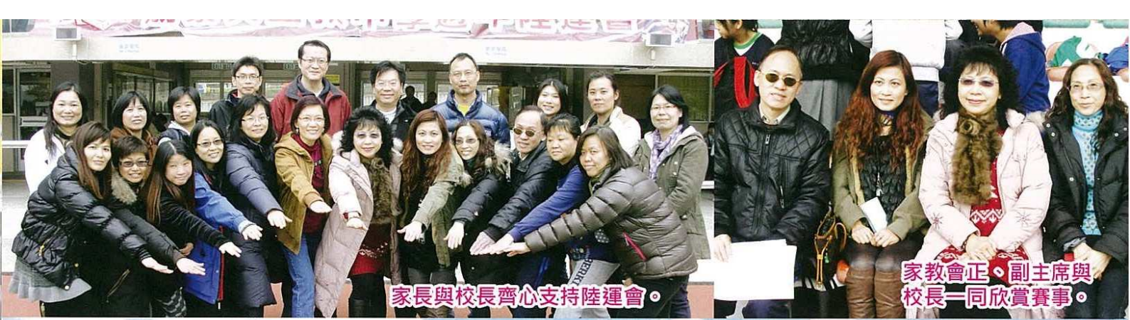
家長與校長齊心支持陸運會。