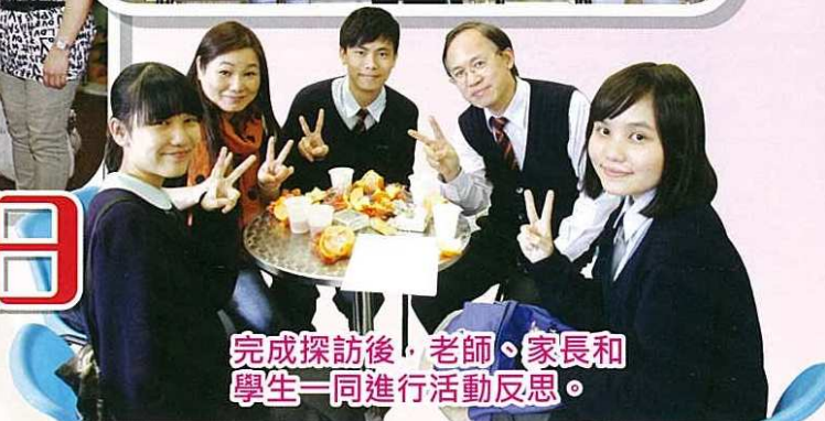
完成探訪後，老師、家長和 學生一同進行活動反思。