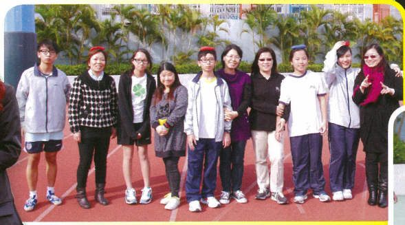
本會幹事與子女一同於親子接力賽大顯身手。