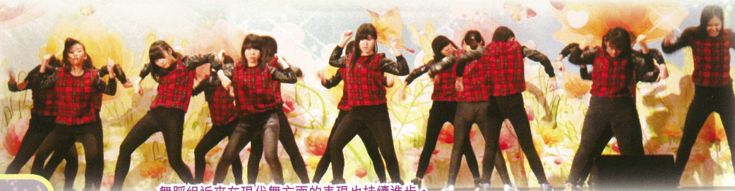
舞蹈組近來在現代舞方面的表現也持續進步。