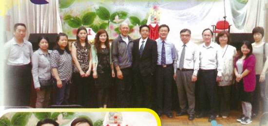
本會幹事與中一學生家長分享心得。