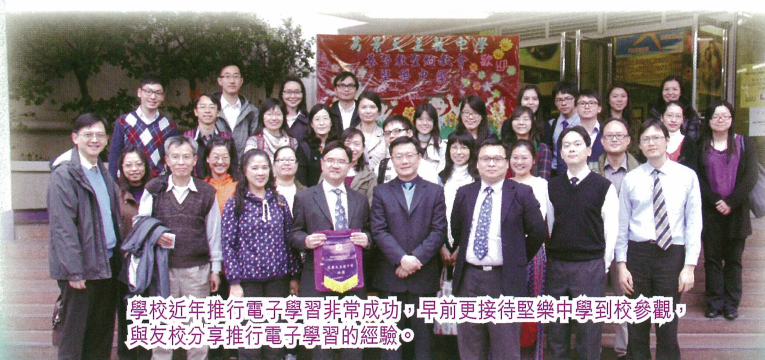
學校近年推行電子學習非常成功，早前更接待聖樂中學到訪參觀，與友校分享推行電子學習的經驗。