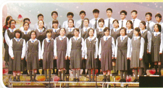
初中同學組成的集誦隊在今年的校際朗誦節取得佳績。