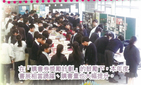
在「購書券獎勵計劃」的鼓勵下，本年度書展相當踴躍，購書量也大幅提升。