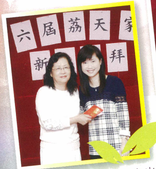
本會榮譽會員余太太也出席了這次團拜。