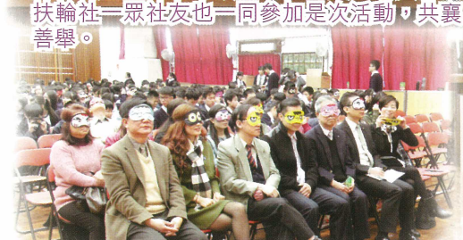
各位家長與扶輪社社友一同戴上眼罩，體驗視障人士的生活障礙。