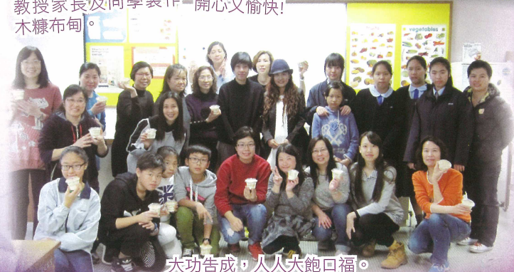
大功告成，人人大飽口福。