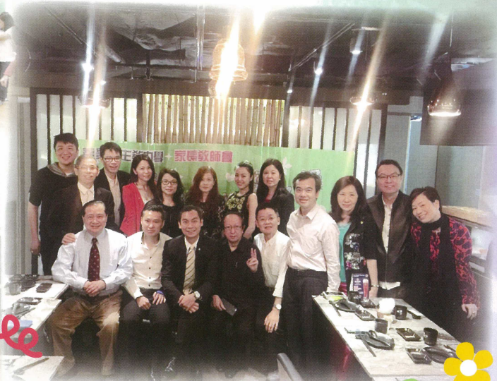
都會扶輪社贊助是次活動經費。