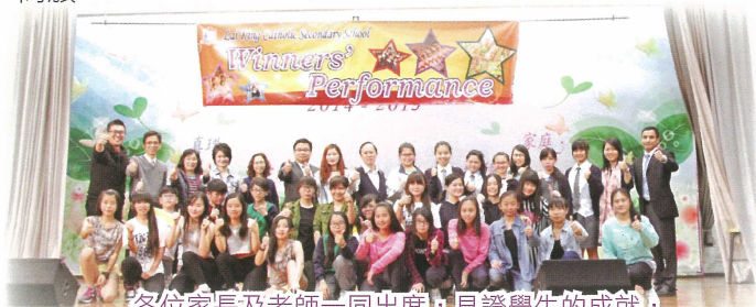
各位家長及老師一同出席，見證學生的成就，實踐啟發潛能教育的精神。

在2015年3月25日中午，我和幾位家長回校欣賞了一場「優勝者表演」，其中一個令我最印象深刻的項目，就是由一班高年級的學生帶着一些低年級的師弟、妹表演的「Hip Hop Jazz」舞蹈，他們精彩的表演，令到全場氣氛高漲。