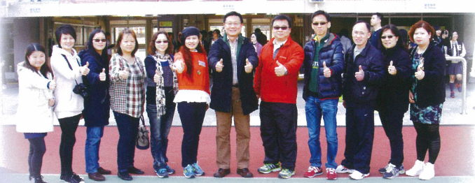
各位家長踴躍到場，為學生打氣。