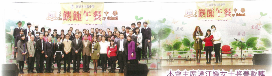
除本校學生外，家教會各位家長，以及都會扶輪社一眾社友也一同參加是次活動，共襄善舉。

這個活動很有意義，讓學生學習要珍惜所有，懂得與別人分享。明白自己的小小付出，可以幫助社會上有需要的人。