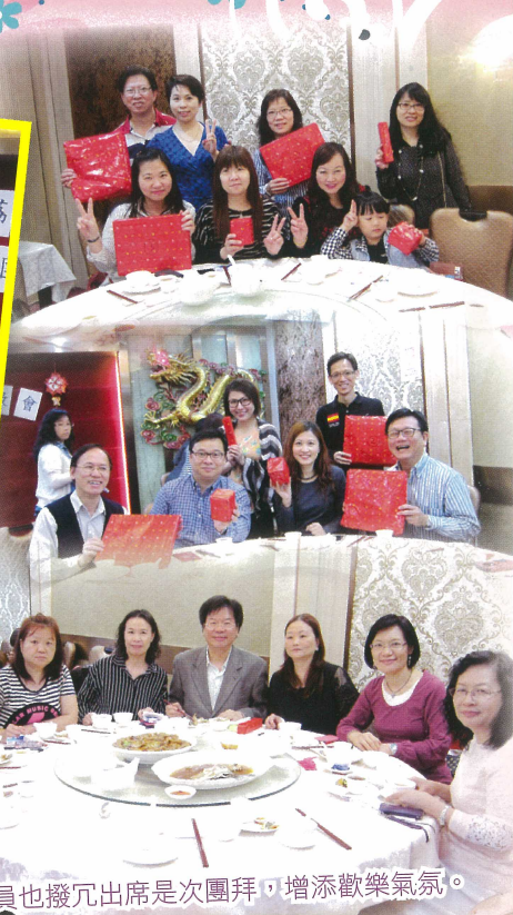
各位名譽會員也撥冗出席是次團拜，增添歡樂氣氛。