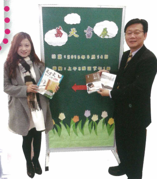
良好的閱讀習慣對學生的語文、思維能力有莫大益，因此本會亦大力支持「購書券獎勵計劃」。