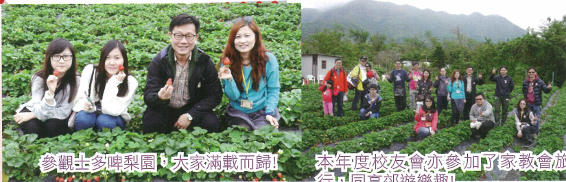
參觀士多啤梨園，大家滿載而歸!

來到「士多啤梨園」見到又大又紅的士多啤梨，校長、老師、家長及學生們個個愛不釋手，爭相拍照、不亦樂乎。最後的一站「農莊」給我們看到大自然的偉大，孕育出各種各樣的植物和動物。這次「萬里路」之旅真是獲益良多。