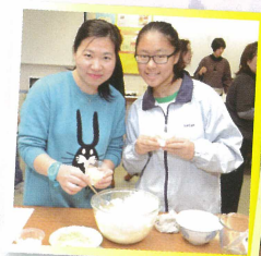
親子共同製作食品，開心又愉快！