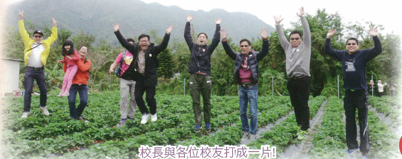
校長與各位校友打成一片!