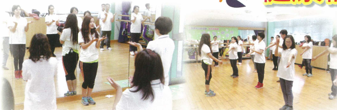
培養健康的身體，由小運動開始。