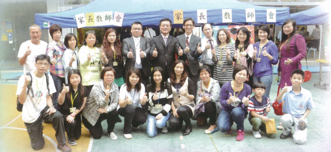
家教會於開放日期間設置了一個遊戲攤位，吸引大批訪客參觀及試玩遊戲。