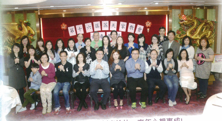
家教會全人恭賀各位新春愉快、來年心想事成!