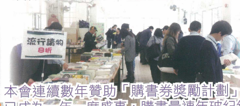
本會連續數年贊助「購書券獎勵計劃」，學校年度書展已成為一年一度盛事，購書量連年破紀錄。