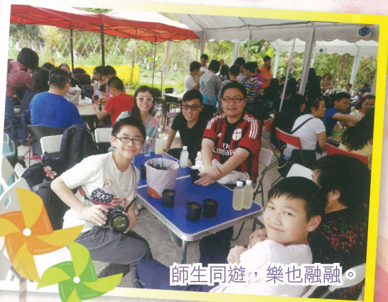
師生同遊，樂也融融。