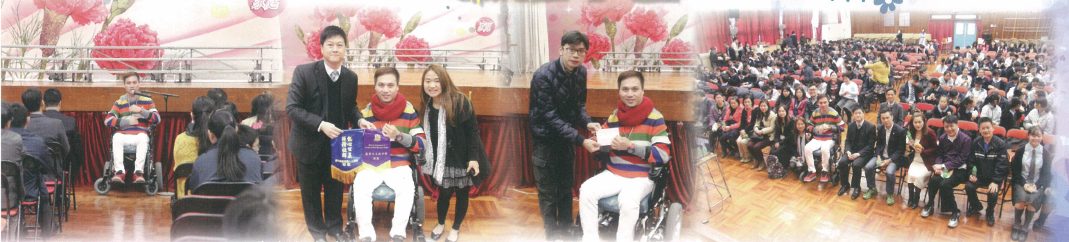
本會主席將善款交予受惠機構路向四肢傷殘人士協會的代表。