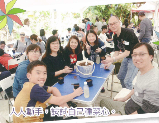
人人動手，試試自己種菜心。