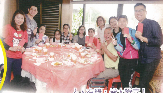
人人有獎，皆大歡喜！